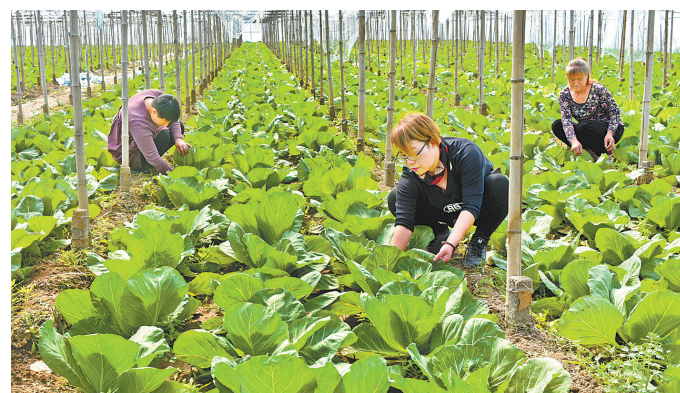
3月25日,在泊头园农农庄大棚里,工作人员正在忙碌。园农农庄有400亩土地,吸收附近富余劳动力和贫困户来庄园进行葡萄、草莓、西红柿等大棚果蔬种植,带动附近村民脱贫致富。

建标准。各县市区党委、政府把开展“百乡(镇)联创、千村示范”活动作为推进乡村振兴战略的重要抓手,党委、政府一把手亲自挂帅督战,坐镇指挥;分管副职亲临一线,直接调度;要总体布局、统筹推进,制定具体创建方案,明确时间表、路线图,强化工作措施全力推动;要选派能力强、素质高、业务精的骨干力量加强和充实农村人居环境,财政专项列支业务经费,确保工作有人抓、项目有钱干。