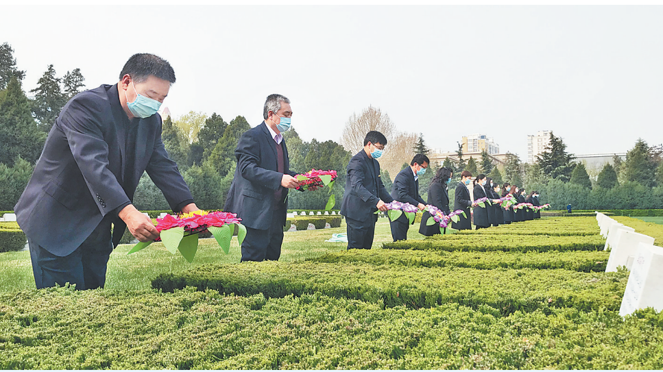
▲清明期间,华北军区烈士陵园推出“代祭”服务,代为烈属祭扫,表达缅怀之情。图为工作人员为烈士墓献花。