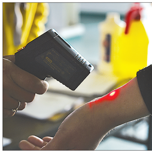
上图:4月11日早晨,平阳村手工业扶贫车间,到岗工人接受体温检测。