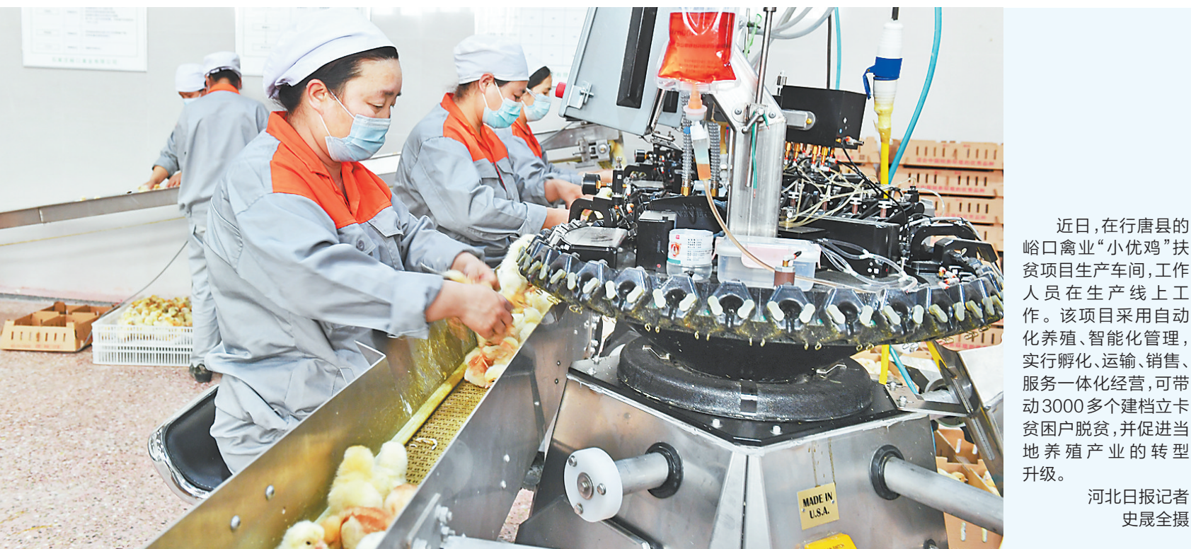
近日,在行唐县的峪口禽业“小优鸡”扶贫项目生产车间,工作人员在生产线上工作。该项目采用自动化养殖、智能化管理,实行孵化、运输、销售、服务一体化经营,可带动3000多个建档立卡贫困户脱贫,并促进当地养殖产业的转型升级。