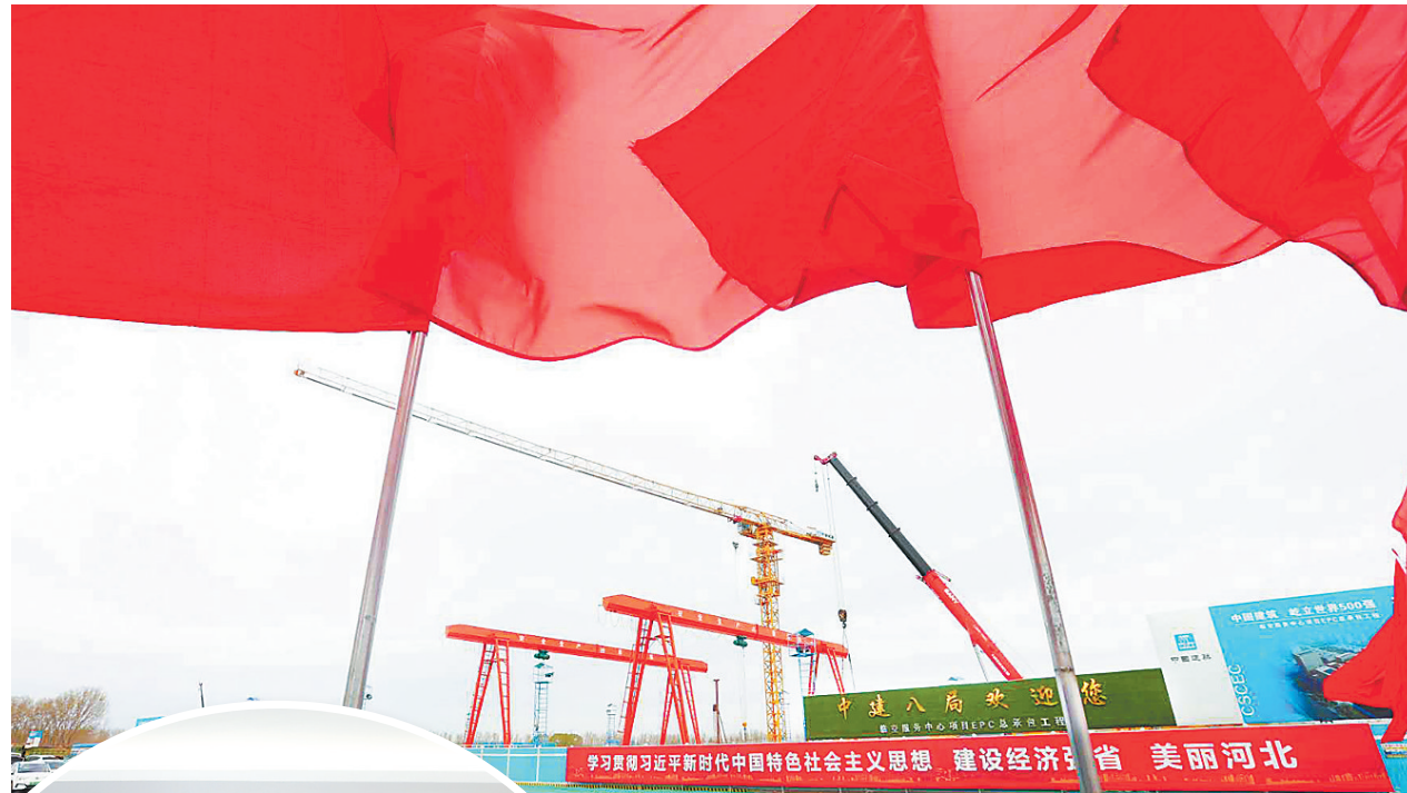
▲廊坊临空经济区起步区,临空服务中心项目建设正在紧锣密鼓地进行。

申运山负责拆迁工作,每天驻守在村里,和村街负责同志一同入户走访,巡查环境整治情况,为推进项目建设日夜奔波。几天前,邢营村电路迁改工程受阻,他连续5天到村民家中,耐心沟通,细致解读征迁政策、项目建设意义,最终顺利促成了迁改。