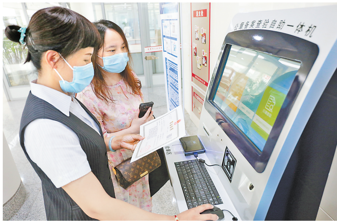
邯郸市行政审批局设立企业服务专区,将登记注册、发票申领、公章刻制等企业开办环节全部纳入服务专区,实现企业信息即时互通共享,使企业开办全部环节可在服务专区完成,为企业开办提供“一站式”服务。这是市行政审批局工作人员帮助企业申请注册人员办理公章备案。

针对企业反映强烈的“注销难”问题,邯郸市将注销登记所需的清算组备案证明、清算报告等10份材料,简化为申请书、授权委托书、全体投资人承诺