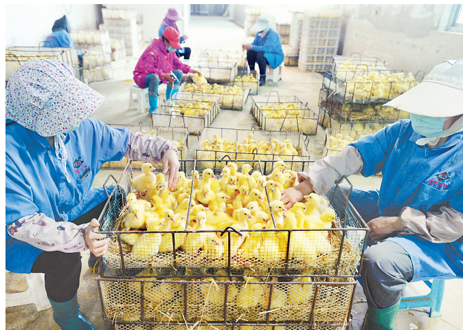
6月3日,迁安市正农养殖公司的工作人员在挑选雏鹅。该公司采取“公司+农户”的专业合作经营模式,每年可孵化雏鹅200万羽,产鹅蛋400余万枚,年销售额近5000万元,有效带动了当地村民增收致富。

为扶持电商发展,乐亭建立了农产品研发体验中心、乐亭县农村电商公共培训中心,建设了1400平方米的县级仓储物流配送中心。截至目前,乐亭登记注册电子商务企业超30家。2019年,该县电子商务交易额达到6.33亿元,同比增长46.2%。