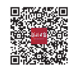
扫码看视频

日前,冀州区冀州镇辉家村贫困户董益国收到意外惊喜。民政部门给他送来6520元防贫保险救助金。今年4月,董益国为上大学的女儿申请了8000元的助学贷款。作为非持续稳定贫困户,(下转第三版)