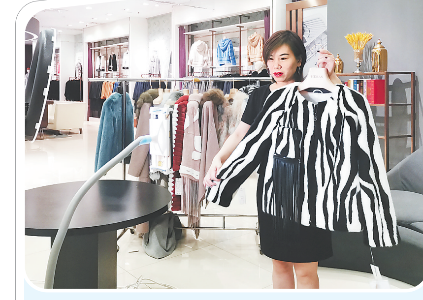
下图:肃宁县华斯裘皮城一名商户正在通过直播销售裘皮服装。