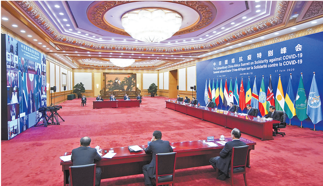
6月17日晚,国家主席习近平在北京主持中非团结抗疫特别峰会并发表题为《团结抗疫 共克时艰》的主旨讲话。

中非应坚持人民至上、生命至上,尽最大努力保护人民生命安全和身体健康,坚定不移携手抗击疫情,坚定不移推进中非合作,坚定不移践行多边主义,坚定不移推进中非友好,共同打造中非卫生健康共同体和更加紧密的中非命运共同体