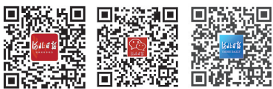
请关注河北日报微博、微信、客户端

尊敬的拉马福萨总统, 尊敬的萨勒总统, 尊敬的各位国家元首、政府首脑, 尊敬的非洲联盟委员会主席法基先生, 尊敬的联合国秘书长古特雷斯先生, 尊敬的世界卫生组织总干事谭德塞先生, 在全球抗击新冠肺炎疫情的重要