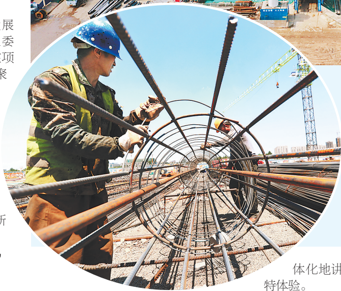
▲京东集团华北(廊坊)云数据中心共规划建设4栋数据机房楼,其中一期工程已于今年4月份开工建设,预计明年第二季度投产交付。这是工人们在进行钢筋加固。

闲置土地512.4亩,成功对接高端项目97个。通过全面清理低效用地,开发区土地集约利用水平有了显著提升,截至目前,每平方公里GDP达到14.4亿元,处于全省领先水平。