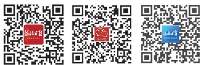
请关注河北日报微博、微信、客户端

为确保棚户区居民早日“出棚进楼”,省住建厅高度重视棚改续建项目建设,特别对2017年及以前开工尚未建成的项目建立了工作台账,实行销号式管理,持续跟踪督办,杜绝开工有日、竣工无期现象。