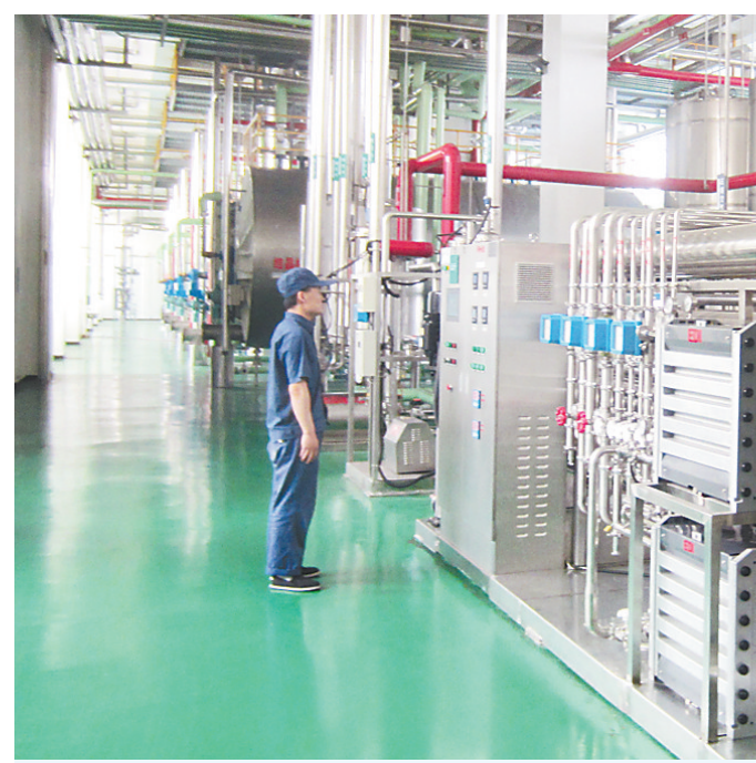
▲7月13日,在秦皇岛骊骅淀粉股份有限公司葡萄糖生产车间内,工人正在进行日常巡检。

发挥非诉讼方式解决纠纷提供司法保障的职能作用,通过在诉讼服务中心配备速裁团队、指导法官,为各调解组织、调解员开展人民调解工作提供支持帮助的方式,完善诉调一体对接机制,推进诉讼程序简