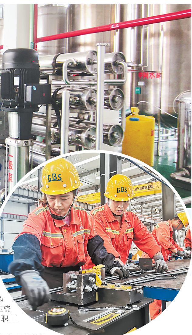
▲7月13日,在秦皇岛骊骅淀粉股份有限公司葡萄糖生产车间内,工人正在进行日常巡检。