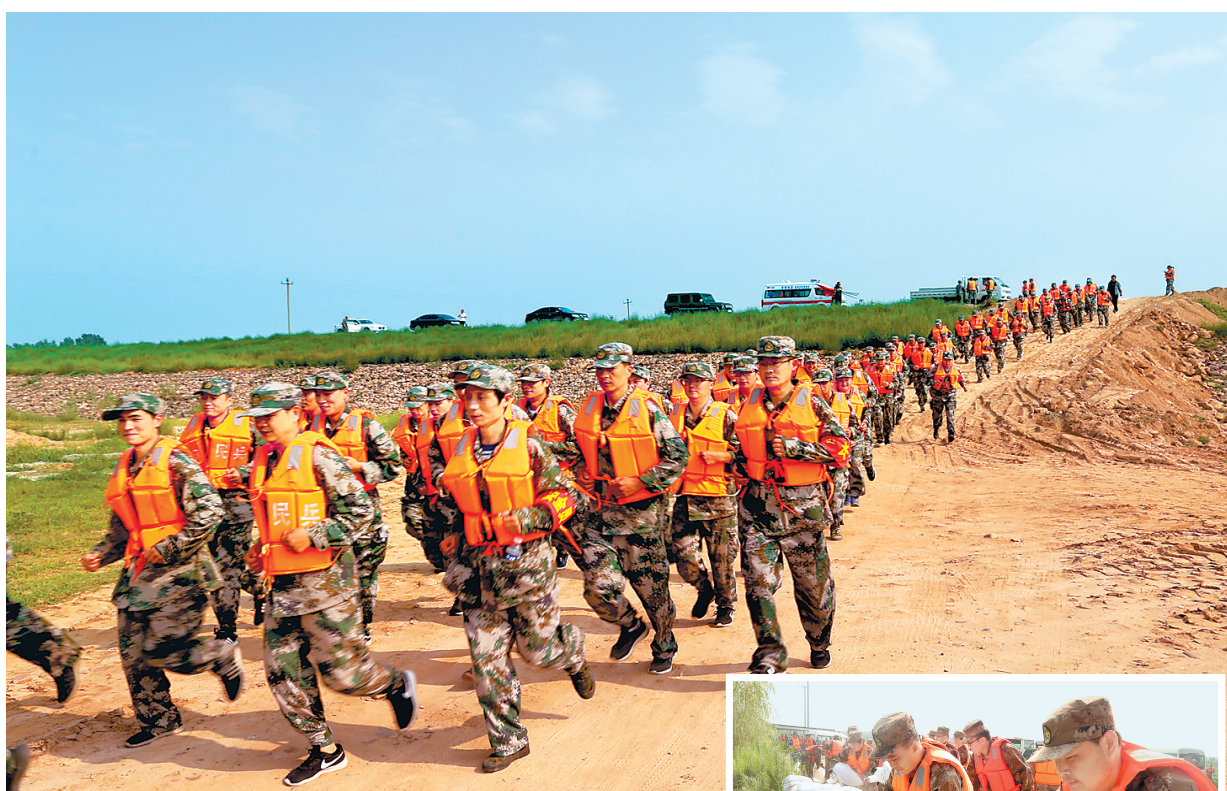
▲7月13日至15日,邢台军分区组织18支民兵应急分队2200余人,分赴重点水域和险情地段,开展72小时抗洪抢险实兵实装拉动演练。图为民兵应急分队在紧急集结。