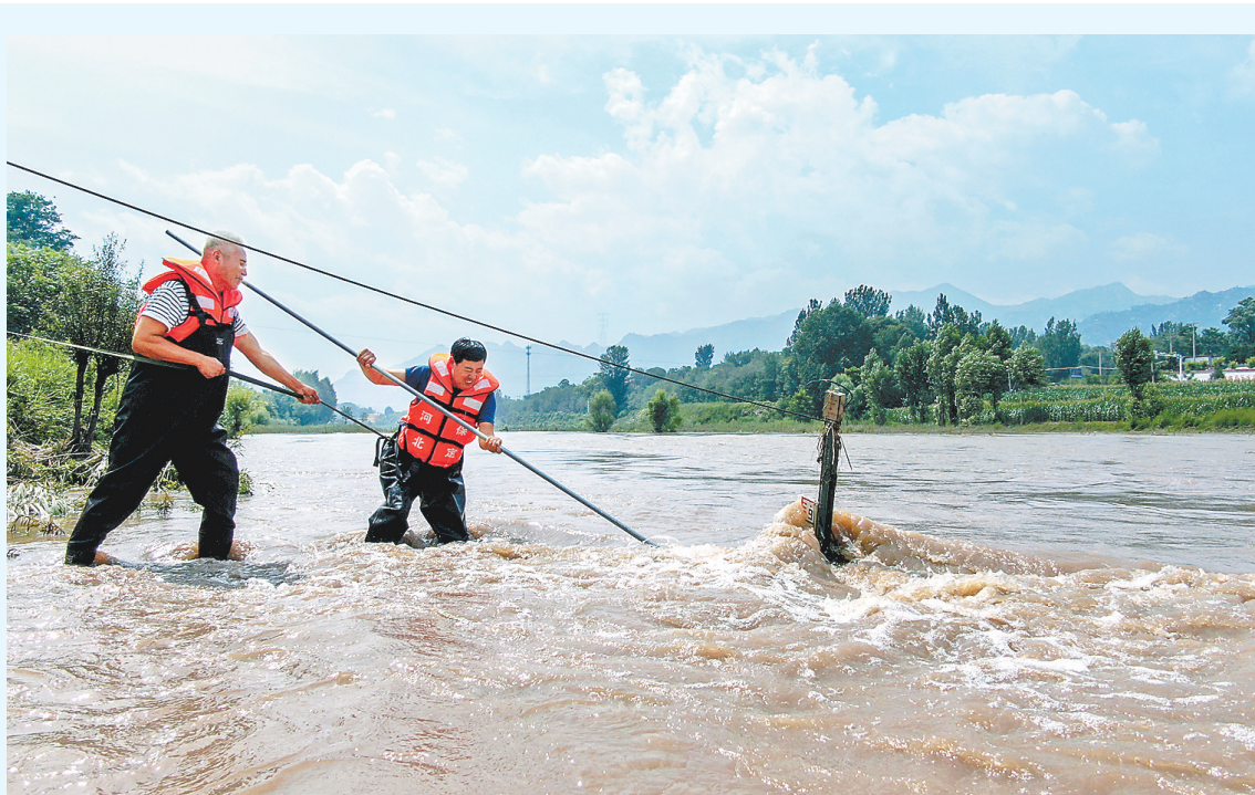
7月19日,位于易县的紫荆关水文站工作人员正在清理缠绕在电子水尺上的杂物。7月17日,大清河水系拒马河紫荆关水文站上游普降大雨,其中涞源县东团堡站降雨量达到108.8毫米。受此次降雨影响,紫荆关水文站监测断面18日5时22分出现148.0立方米/秒的最大洪峰流量。目前,保定市16处水文站严阵以待,密切监测水文数据,为防汛减灾提供可靠数据支撑。

截至7月20日8时,全省大、中型水库总蓄水量21.81亿立方米,比去年同期少蓄水3.31亿立方米,比常年同期多蓄水2.79亿立方米。其中18座大型水库蓄水18.35亿立方米,比常年同期多蓄水2.52亿立方米;44座中型水库蓄水3.46亿立方米,比常年同期多蓄水0.25亿立方米;平原洼淀(白洋淀、衡水湖、大狼淀)蓄水4.94亿立方米。