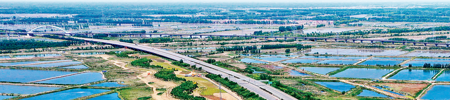
唐山至曹妃甸生态廊道曹妃甸段,苗木的翠绿和稻塘的蔚蓝相互交错,构成一幅优美和谐的生态画卷。