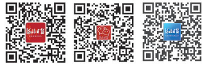
请关注河北日报微博、微信、客户端

国际热核聚变实验堆计划是当今世界规模最大、影响最深远的国际大科学工程，我国于2006年正式签约加入该计划