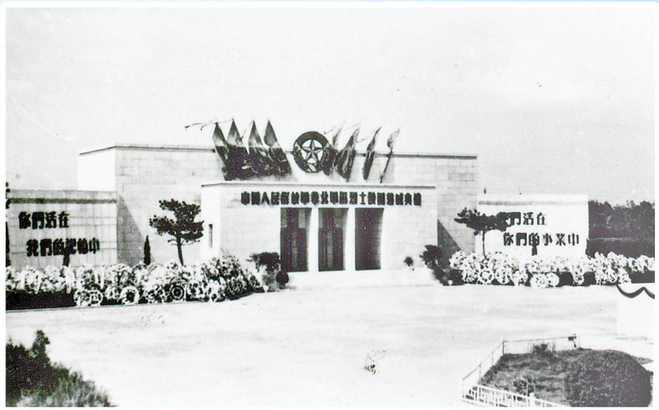
华北军区烈士陵园建园时纪念碑全景。

这两大烈士陵园是怎样建成的?它们有着怎样的前世今生?安葬在陵园的烈士身后有着哪些鲜为人知的故事?