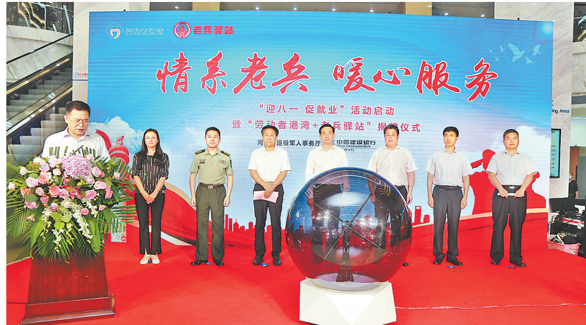
政银企共架合作之桥,共铺服务之路,进一步服务好退役军人。日前,省退役军人事务厅与建行河北省分行在省会举行“劳动者港湾+老兵驿站”揭牌仪式。