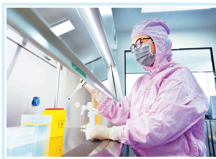
在保定中关村创新基地,保定诺未科技有限公司干细胞储存及细胞技术研发与生产项目技术人员正在配制实验试剂。

着力办好“三件大事”,科技创新是重中之重;从“双创双服”到“三深化三提升”,再到“三创四建”,从科技创新三年行动计划到县域科技创新跃升计划,大力推动创新创业始终是不变的主题。 围绕产业链部署创新链,梳理全省重点产业领域148项关键核心技术清单,新机制、新模式的省产业技术研究院等创新平台建设步伐加快,省级以上研发平台从2016年的409家增长到2020年的1211家,实现翻倍。 (下转第三版)