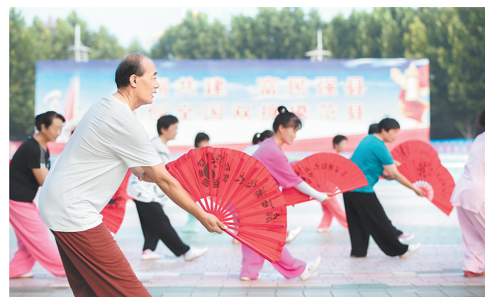
日前,乐亭县群众在青春广场上练习太极扇。近年来,该县积极引导群众进行多样化、常态化、科学化健身,发展了太极系列、柔力球、交谊舞、健身操(课)等10余个集趣味性和艺术性于一体的健身项目,开展丰富多彩的全民健身活动。

据了解,在“零酒驾”创建活动中,市交警部门以城市酒吧、饭店、娱乐场所,乡镇酒馆、