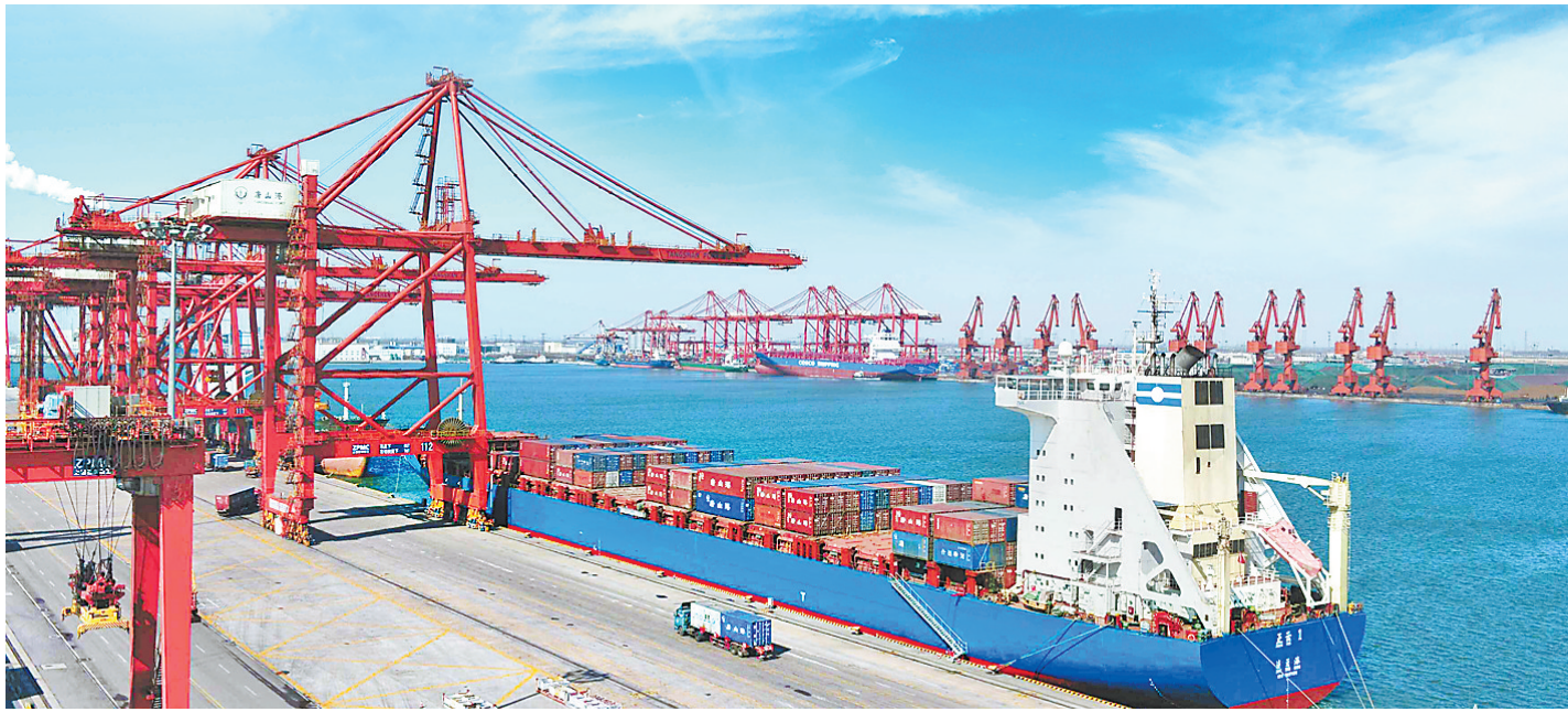
▲日前,靠泊在唐山港京唐港区集装箱专业码头的货轮正在进行装卸作业。依托深水大港优势,唐山市着力提升港口能级,努力实现吞吐量逆势增长。