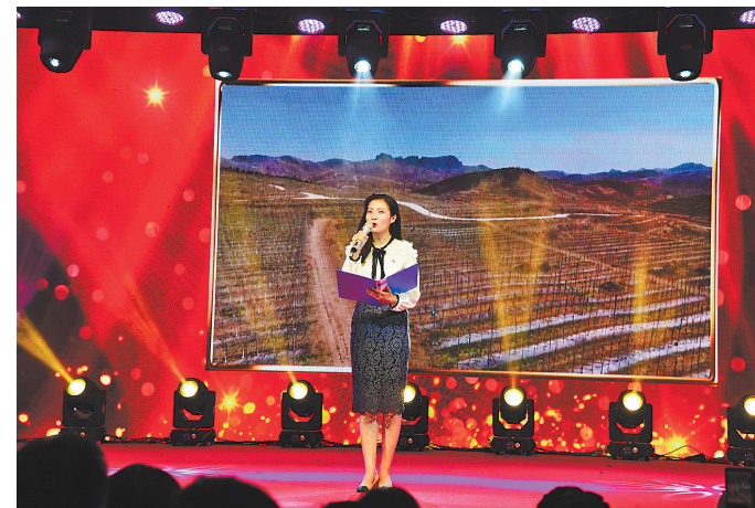
8月3日晚,顺平县举办了以“百姓冷暖记心间”为主题的脱贫攻坚朗诵比赛。来自该县扶贫战线的20支参赛队,讲述了一个个感人的扶贫故事。

础的市场生态。倡导中药材生产经营主体把好质量关,中药材质量检测由被动抽检到主动检测,从过去的部分环节、部分品种、部分项目检测,逐步实现检测全产业链覆盖、全市场覆盖、全品种覆盖、全项目覆盖;各中药材专业市场健全中药材第三方质量检测体系,补充检验检测能力,补齐监督职能短板;倡导政府部门推动质量诚信体系建设,持续开展质量追溯项目,制定检验检测优惠政策,建设好中药材质量追溯查询系统,让伪劣中药材无处立足。