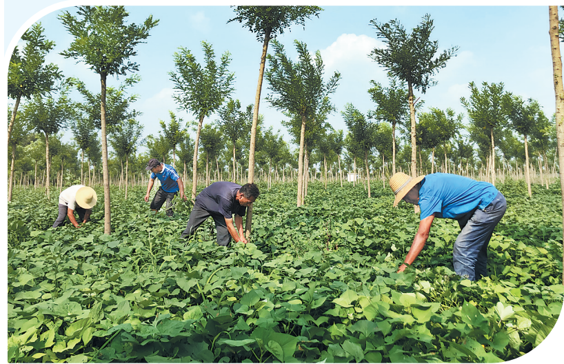
▲近日,在位于高阳县东何家庄村北的环雄安新区生态林带,保定景岚景观工程有限公司的工人们正在拔草。