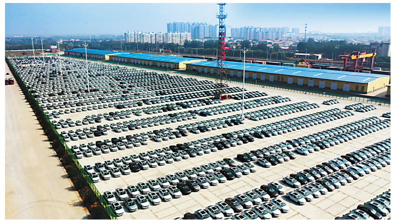
▲冀中南智能港汽车产业园航拍图。

绿卡”政策,进一步提高建陶专业人才的待遇水平,鼓励重点大学毕业生到高邑就业,鼓励全县陶瓷企业跟大学和陶瓷科研院所人员建立产学研基地。