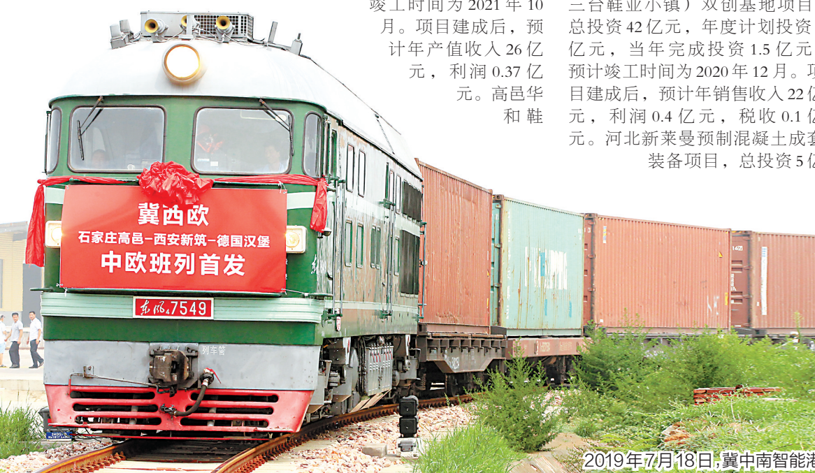
2019年7月18日,冀中南智能港冀西欧国际货运班列首发。