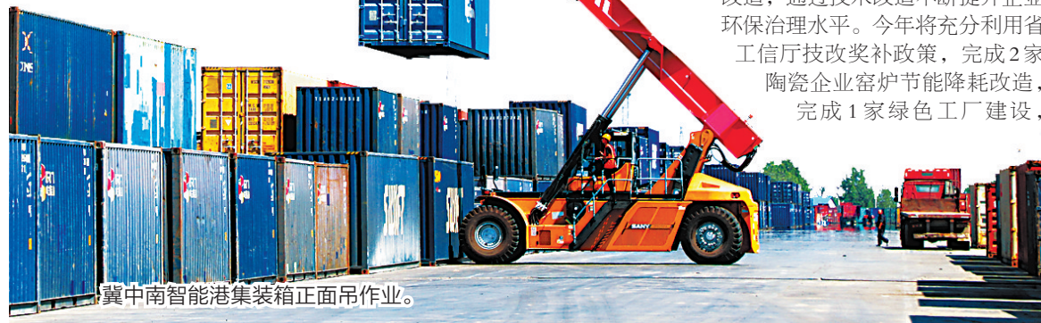
冀中南智能港集装箱正面吊作业。

加大拓宽销售市场。政府引领搭建市场平台,引导重点建陶企业“走出去”;创新产品销售模式,提高产品市场占有率。今年将引入战略营销公司,充分利用冀中南智能港的优势,向大西南开拓陶瓷市场,建立高邑陶瓷西南总部基地;