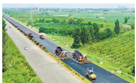
邢台路桥坚持环保第一,绿色施工。图为施工现场。

线长达10多公里,点多线长。路基施工中,钩机挖土方,各种卡车来往穿梭,工地扬尘是一个绕不过去的坎。