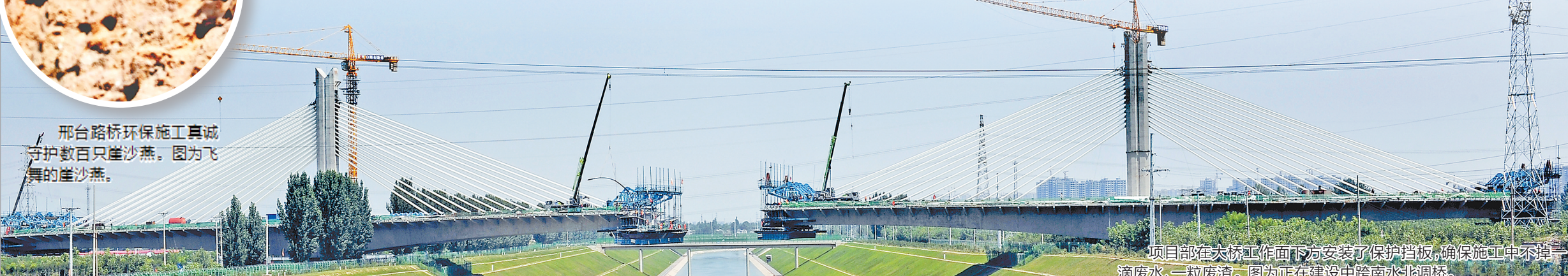
邢台路桥环保施工真诚守护数百只崖沙燕。图为飞行的崖沙燕。

“这不是摆样子。”程涛解释说,路通了路畅了,老百姓方便了,这是我们修路的应有之义。但作为国有企业,我们不能忘了服务的本质。走一方,爱一方,应学会换位思考,永远把老百姓的利益放在第一位,不仅把路修好留在当地,更要把邢台路桥的口碑留在老百姓的心坎上。(文/王志、刘叶芝)