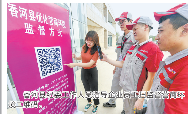
香河县纪委监委工作人员指导企业员工扫描监督营商环境二维码。

“今年,我们在机关党建抓规范的基础上,重点推动实施‘五强化五提升’机关党建提升工程和机关‘五好红旗支部’创建工作,不断提高党支部标准化、规范化建设质量,不断增强党支部的凝聚力和战斗力,切实发挥好基层党组织的战斗堡垒作用。”香河县直机关工委委书记李文建说。(文/解旺)