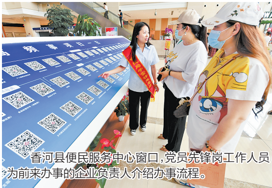
香河县便民服务中心窗口,党员先锋岗工作人员为前来办事的企业负责人介绍办事流程。

近年来,香河县直机关工委紧紧围绕中心工作,不断创新基层党组织活动的内容与方式,以“五规范五加强”为载体,全面提高机关党建质量,使各级党组织始终保持蓬勃生机和旺盛活力。 规范思想政治建设,加强担当精神培育。他们建议县委制定印发了《关于建立健全机关党建制度机制推进机关治理和事业发展的意见》《关于加强和改进县直机关党的建设的实施意见》,为县直各单位扎实推进党的建设的提供了遵循,在机关党建中尚属首次。印发《关于加强县直机关党组织理论学习的安排意见》,有力推动了县直机关各级党组织理论学习走上正轨,学习强国学习情况全县排名第一。每月定期对党组织书记发放任务清单,明确党建工作重点内容和具体要求,确保机关党建工作目标清、思路明。积极完善机关党建督导机制,累计督导机关党支部201个,督导整改问题325个,大力促进和推动了党建各项工作目标的有效落实。