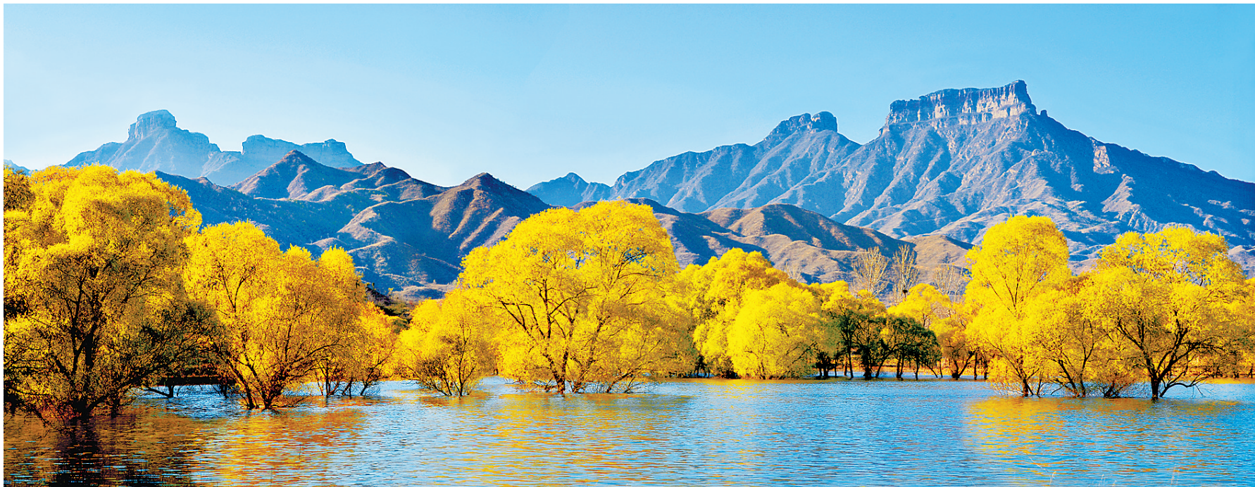
▲赞皇县许乡平泉湖的旖旎风光。