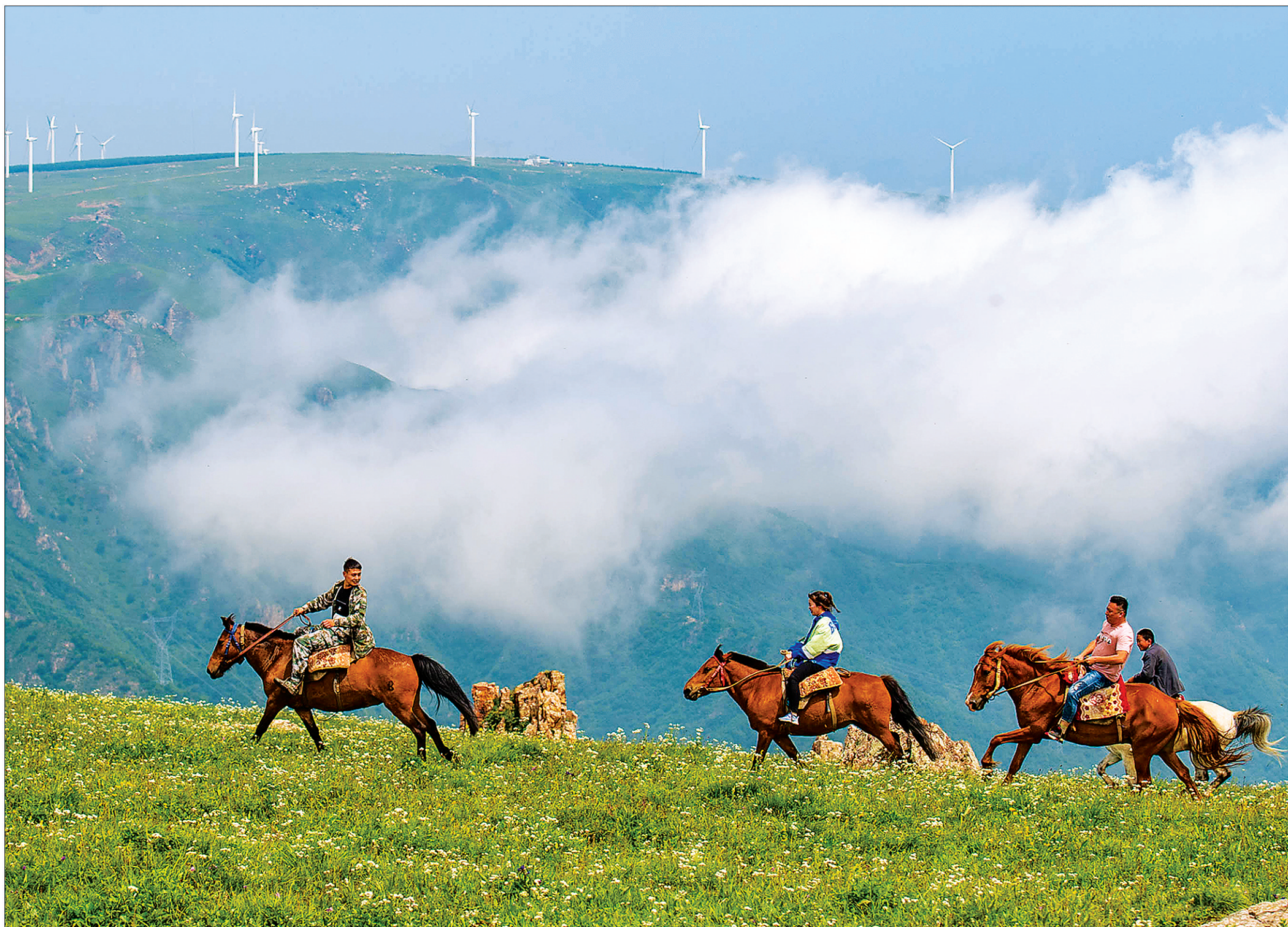
上图:十八盘村村民带着游客在涞源县空中草原骑马游玩。