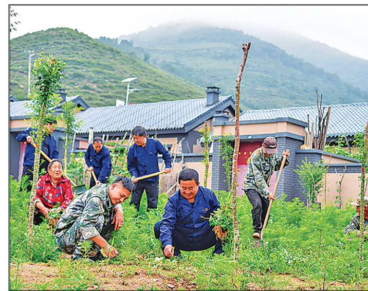
上图:驻村工作队和村民在村中植绿美化村容村貌。