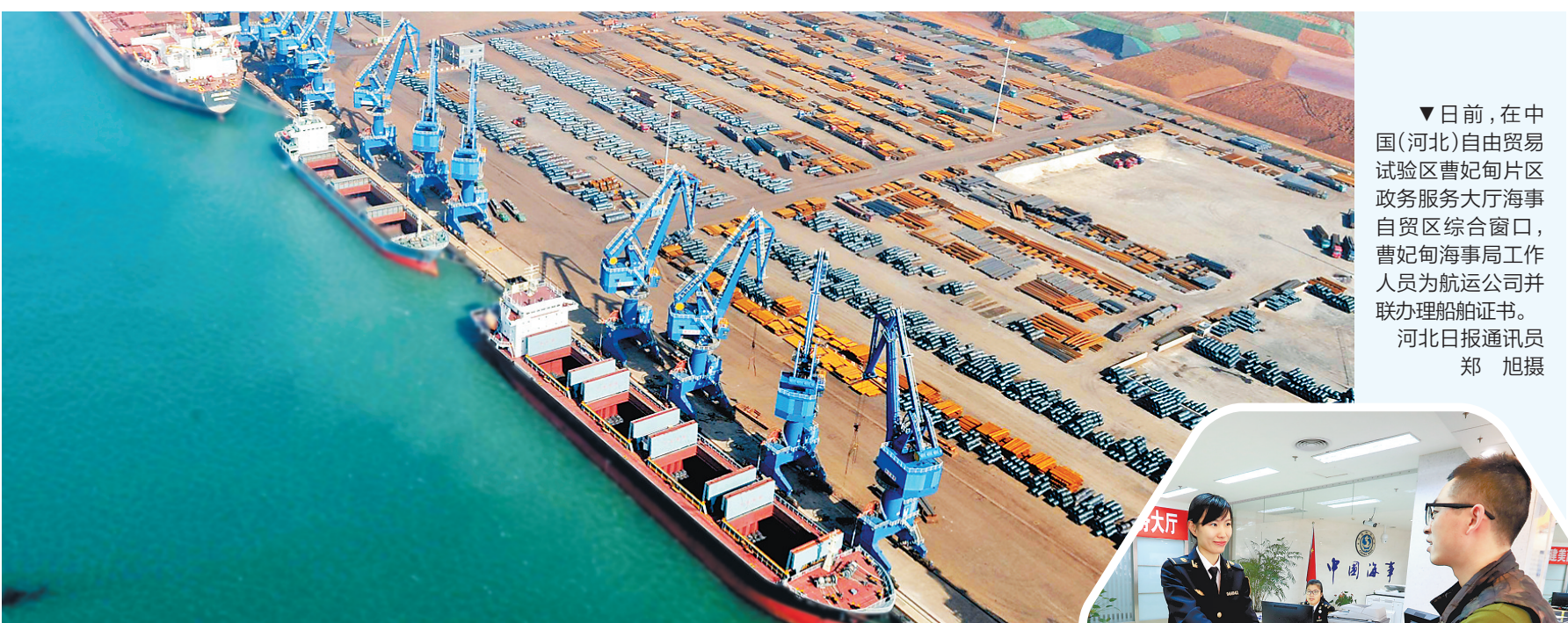
▲日前,在曹妃甸港区通用码头,货轮停靠泊位上正在接卸货物。中国(河北)自由贸易试验区曹妃甸片区机制不断创新,助推港口业务多元发展,增强了曹妃甸港区外贸发展竞争力。