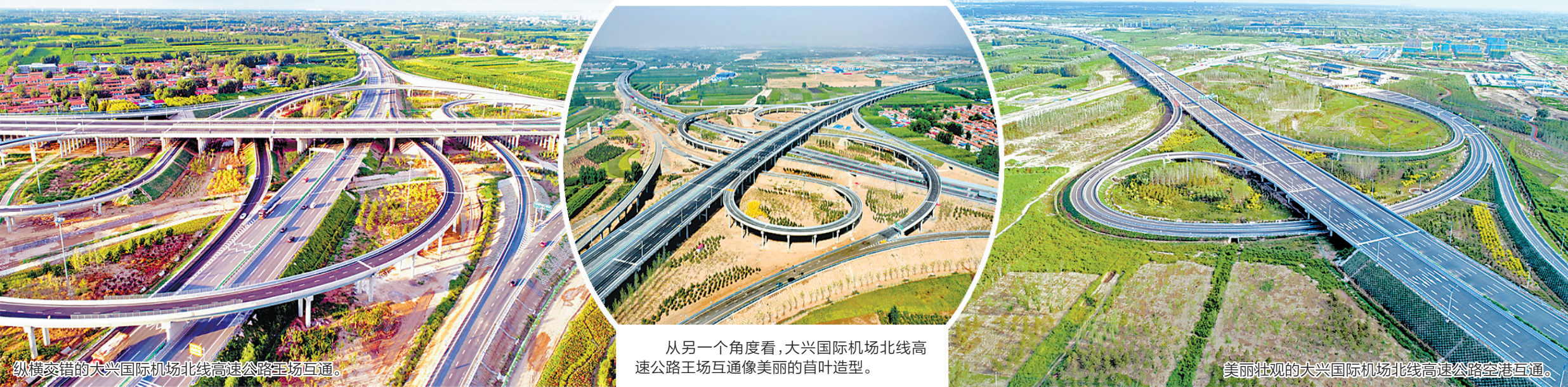
纵横交错的大兴国际机场北线高速公路机场互通。