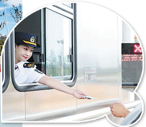
大兴国际机场北线高速公路空港收费站收费员文明规范服务过往车辆。

新机场北线高速廊坊段空港站是一个新建站,设置四进六出车道。由于临近大兴国际机场和廊坊市的一号工程——廊坊临空经济区,还是进出的必由之路,