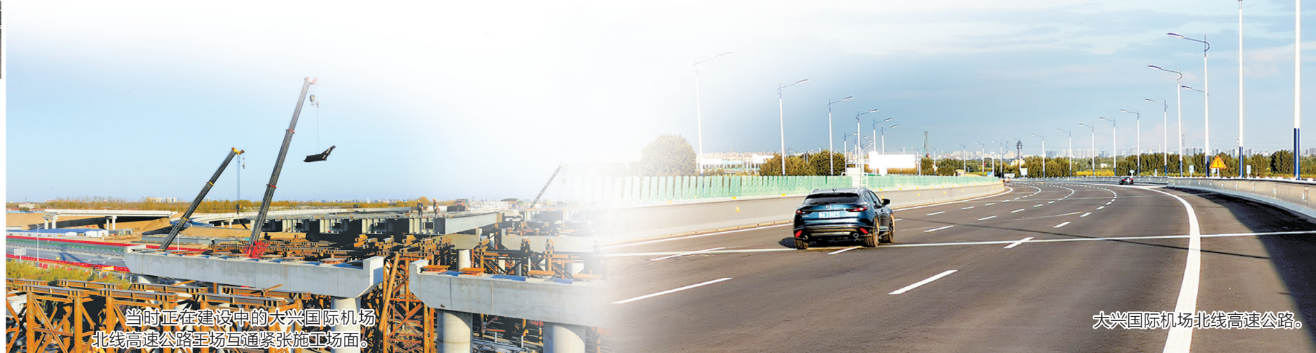
大兴国际机场北线高速公路。