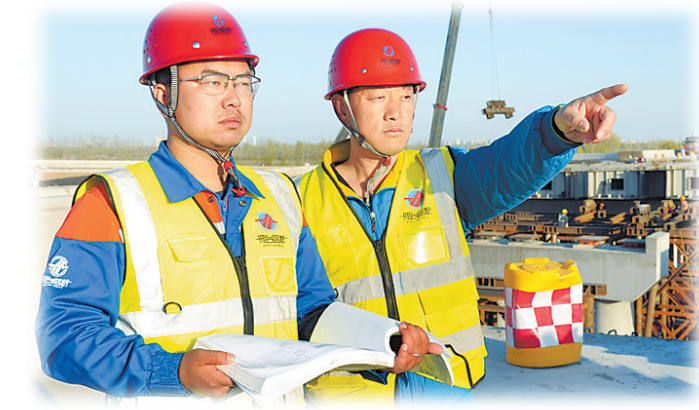
当时正在建设中的邢台路桥建设总公司施工管理人员严格施工。

由邢台路桥牵头成立了河北首都新机场高速公路开发有限公司,下辖两个收费站,一个是新机场北线高速廊坊段空港收费站,一个是廊坊收费站。廊坊收费站