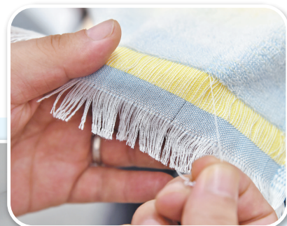
▲9月17日,第三届河北国际工业设计周河北工业设计成果展区内,来自保定高阳的河北瑞春纺织有限公司工作人员正在展示抽丝完成后的“解压毛巾”。

业内专家介绍,工业设计在推动传统产业转型升级、新兴产业形成发展、优势产业扩大优势等方面作用巨大,能促进相关产品从技术、标准、规则的模仿者、遵守者逐步转变为赶超者、引领者。在我省深入实施创新驱动发展战略的大背景下,工业设计为我省产业结构优化升级增添了新动力。