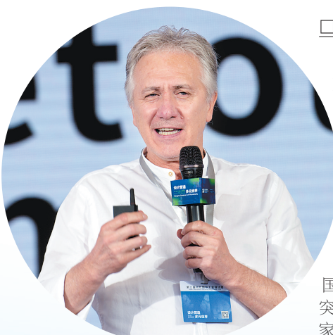
法国阿基坦国家工业创新发展专家帕特里克·吕西安。

帕特里克·吕西安:我很乐意见到大家越来越关注生态,关注资源的循环利用。我自己在做设计的过程中,经常会考虑的一个问题就是我设计的包装能不能被循环利用起来。这些包装资源如果用过一次就被丢弃成为垃圾,那就太浪费了。通常来说,我认为设计一件包装,能有50%以上的循环利用率,才算好的包装,所以我也希望在以后的河北工业设计周上,能看到更多关于生态工业的设计,也希望更多的河北企业关注工业设计的生态效益。