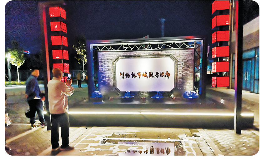
市民在廊坊1898文化商街街头摄影留念。

三角地、老天桥、水塔、碉堡……一座城市的历史记忆，正在被一条承载着历史文化符号的街道唤醒。在廊坊市区老火车站路南端，以“廊坊1898”命名的文化商街今年“十一”开街面世，成为廊坊的文化新地标。 10月3日傍晚，华灯初上。跃华路北头、银河大桥下西侧，远远望见大红的灯笼挂在仿古屏风的两侧，屏风上“廊坊原点城市记忆”的字样提醒人们，这里是城市最初的发源地。 1898文化商街全长1.5公里，拥有3条商业步行街、2个广场和1个文化绿廊，是廊坊城市文化、火车文化、美食文化的大荟萃。文化商街规划为5个功能区，即铁路沿线文化景观带、北部雕塑广场、中部三角地山水演艺广场、南部民国风情美食街和老廊坊城市原点展示馆。 曾几何时，廊坊只是一个鲜为人知的偏僻小村，自1898年京山铁路在这里设站，廊坊才渐成集镇，由此成为一座“火车拉来的城市”。 “看，过去这条街也很热闹！”文化