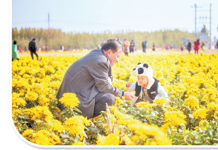
肥乡区促进菊花产业一二三产融合,发展科普研学、乡村旅游等多种业态,增强产业市场竞争力。

金秋十月,走进邯郸市肥乡区南赵村,村庄道路两侧簇簇菊花竞相绽放,千姿百态。菊花园内,菊花仙子、菊花巨龙等栩栩如生,成为游客合影留念的绝佳取景地。赏景之余,你还可以走走色彩斑斓的菊花迷宫,或走进菊花产品展厅,品一杯香气淡雅的菊花茶,饮一杯香醇醉人的菊花酒。如果想给亲友带些特产,琳琅满目的菊花酱、菊花酥、菊花糕等深加工产品,准会让你不虚此行。