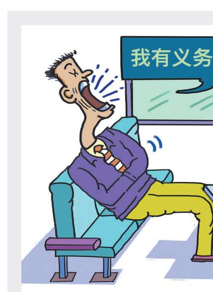
画里有话 图/闵汝明 文/张玉胜

食品监督举报电话,让其在享受权利的同时也需要履行义务,故意拒绝让行,属于另一种形式的“霸座”。