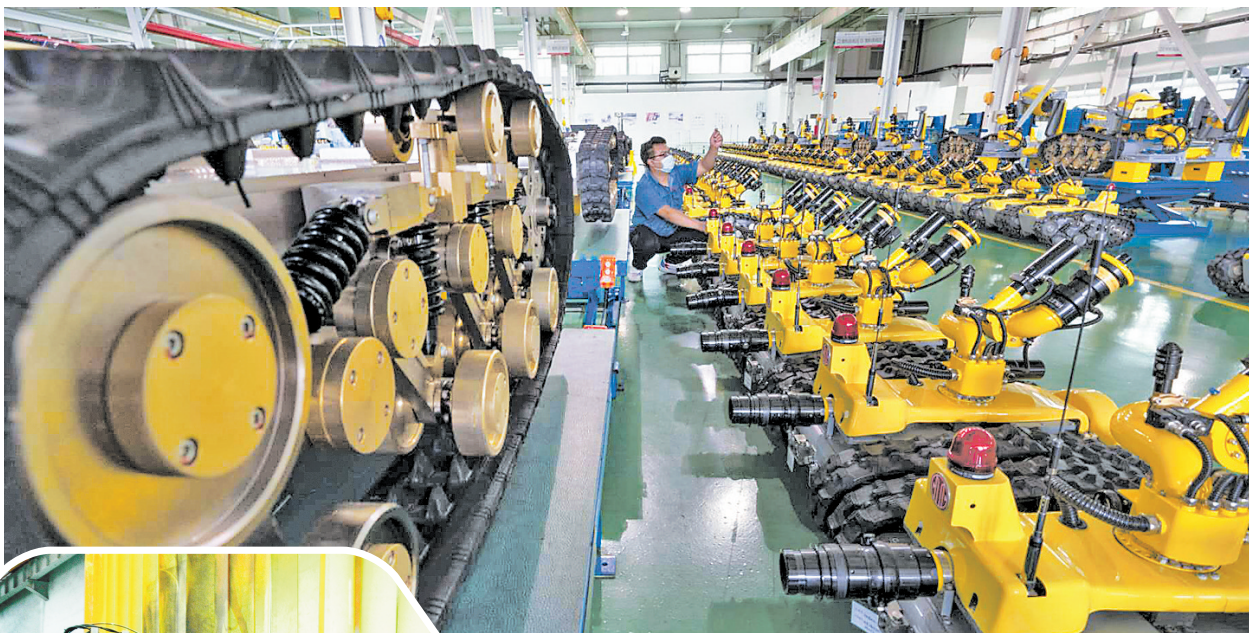
▲日前,中信重工开诚智能装备有限公司的技术工人正在调试特种机器人。近年来,该公司坚持走自主创新之路,以科技为动力,以创新发展,目前拥有国家发明、外观、实用新型等方面专利230余项。