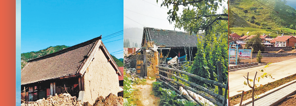
图为省政协机关帮扶村建设现场。

深入地调研,有针对性的建议,让广大群众感受到冬天的温暖。促成全省第一个儿童医院建设,推动我省职业教育改革发展纳入政府决