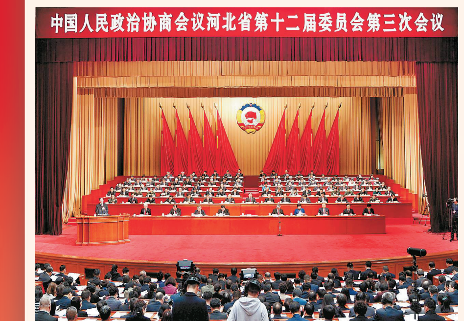
图为省政协十二届三次会议开幕会现场。