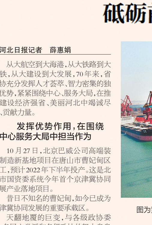
图为黄骅港综合港区集装箱码头。

1948年4月30日,一条电文从这里迅速传遍华夏大地。历经百年战乱的中华儿女纷纷奔走相告——中共中央号召:“各民主党派、各人民团体、各社会贤达迅速召开政治协商会议,讨论并实现召集人民代表大会,成立民主