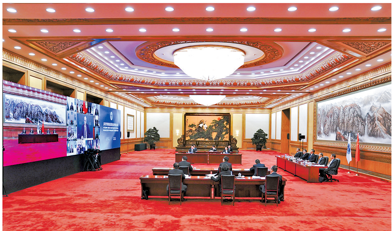
11月10日晚,国家主席习近平在北京以视频方式出席上海合作组织成员国元首理事会第二十次会议并发表重要讲话。

新华社北京11月10日电 国家主席习近平10日晚在北京以视频方式出席上海合作组织成员国元首理事会第二十次会议并发表题为《弘扬“上海精神” 深化团结协作 构建更加紧密的命运共同体》的重要讲话。习近平强调,上海合作组织要弘扬“上海精神”,加强抗疫合作、维护安全稳定、深化务实合作、促进民心相通,携手构建卫生健康共同体、安全共同体、发展共同体、人文共同体,为推动构建人类命运共同体作出更多实践探索。(讲话全文见第二版)