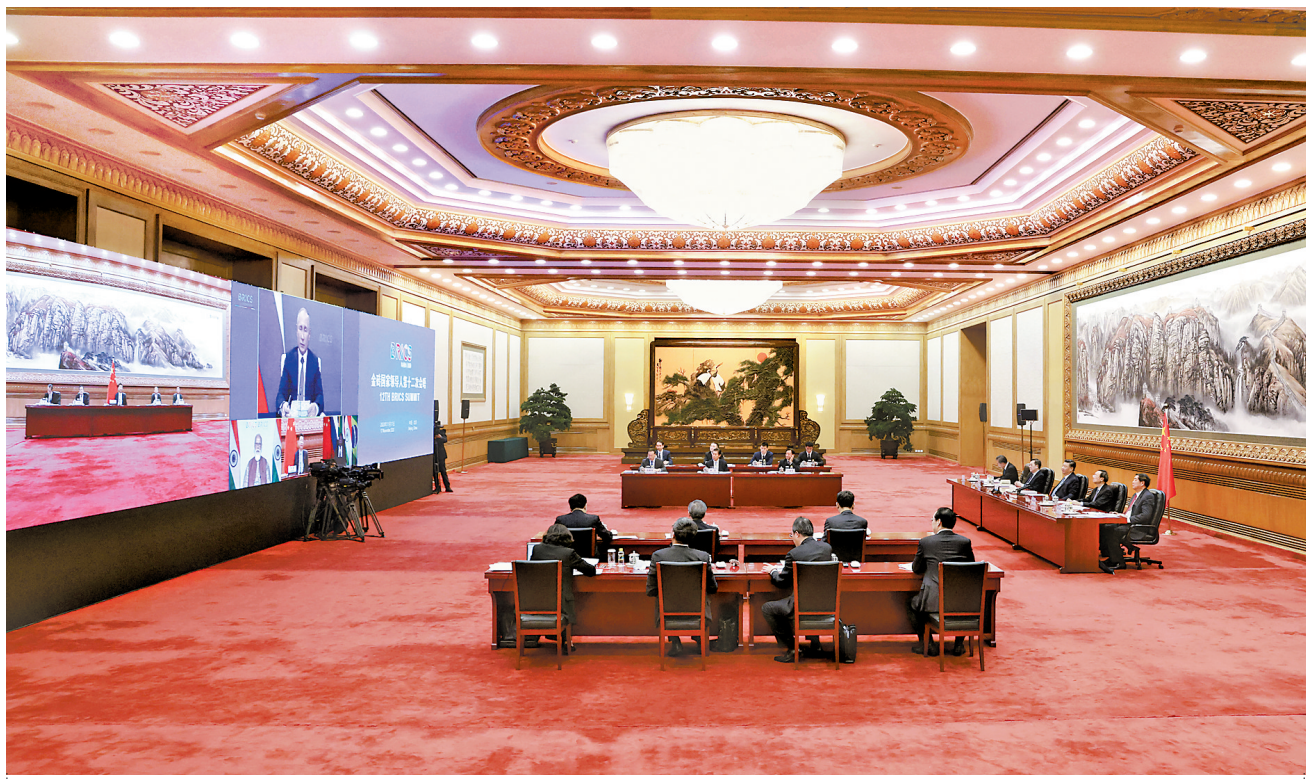
11月17日晚,金砖国家领导人第十二次会晤以视频方式举行。国家主席习近平在北京出席会晤并发表重要讲话。

新华社北京11月17日电 金砖国家领导人第十二次会晤17日晚以视频方式举行。俄罗斯总统普京主持,中国国家主席习近平、印度总理莫迪、南非总统拉马福萨、巴西总统博索纳罗出席。