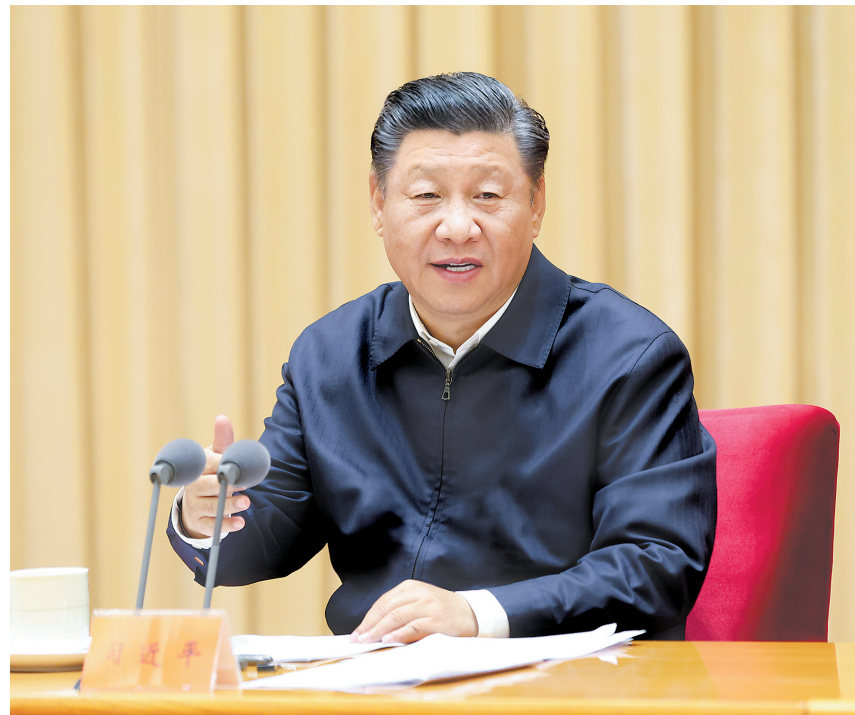
11月16日至17日,中央全面依法治国工作会议在北京召开。中共中央总书记、国家主席、中央军委主席习近平出席会议并发表重要讲话。

习近平提出11个方面要求:要坚持党对全面依法治国的领导。坚持以人民为中心。坚持中国特色社会主义法治道路。坚持依宪治国、依宪执政。坚持在法治轨道上推进国家治理体系和治理能力现代化。坚持建设中国特色社会主义法治体系。坚持依法治国、依法执政、依法行政共同推进,法治国家、法治政府、法治社会一体建设。坚持全面推进科学立法、严格执法、公正司法、全民守法。坚持统筹推进国内法治和涉外法治。坚持建设德才兼备的高素质法治工作队伍。坚持抓住领导干部这个“关键少数”