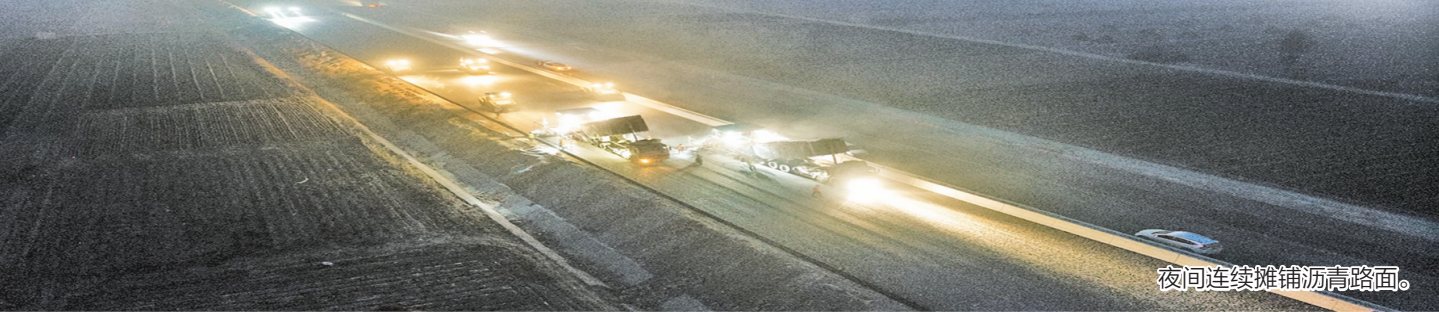
夜间连续摊铺沥青路面。