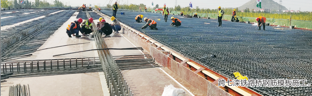
跨七滦铁路桥钢筋模板施工。