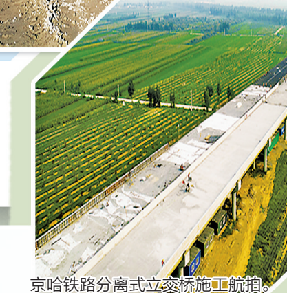
京哈铁路分离式立交桥施工航拍。