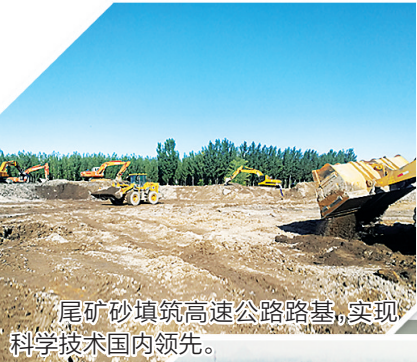
尾矿砂填筑高速公路路基,实现科学技术国内领先。

——边拆迁边施工。大项目部一合同二分部承建跨七滦铁路桥,桥长890米,桥下有二个废弃厂房由于各方面的原因没有及时拆迁,二分部不能进场施工。但是时间不等人,大项目部决定先局部进场施工,边施工边拆迁。首先遇到的问题就是厂子废弃物无处存放,且废弃物正好占据了桩基的位置,大项目部就利用自己的设备,把废弃物临时转移到了自己的临时占地,之后利用一切空当,仅两个月的时间就完成桩基下部结构。其次,为避免建桥施工与同步拆迁发生安全事故,项目部制定了详尽的施工安全方案:安装防坠落设施,进行安全教育,合理处置焊渣,实行错峰施工等。有力的措施加上科学施工,不仅抢得了工期,还避免了冬季施工期,大桥主体如期完工,现正在进行大桥桥面的施工作业。