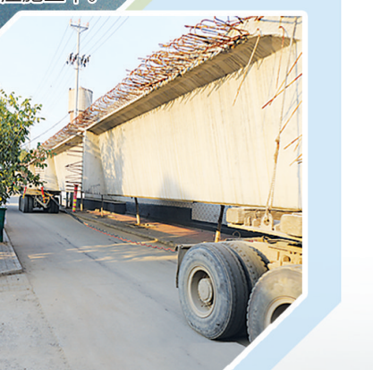
预制箱梁在村庄小路运输。