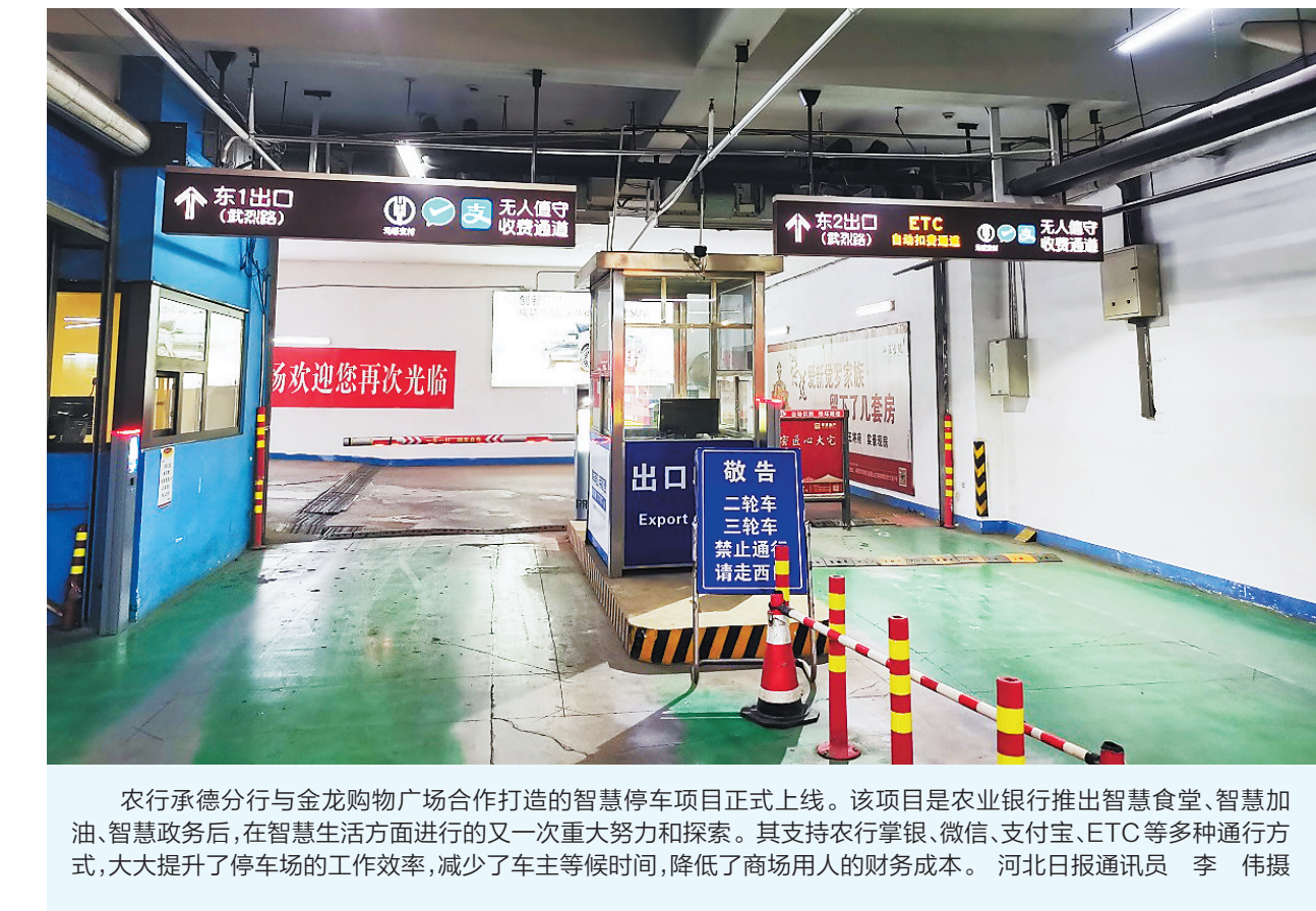
农行承德分行与金龙购物广场合作打造的智慧停车项目正式上线。该项目是农业银行推出智慧食堂、智慧加油、智慧政务后,在智慧生活方面进行的又一次重大努力和探索。其支持农行掌银、微信、支付宝、ETC等多种通行方式,大大提升了停车场的工作效率,减少了车主等候时间,降低了商场用人的财务成本。