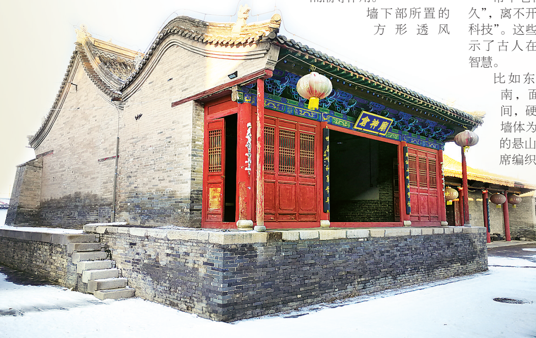
位于蔚县常平仓内的仓神庙。