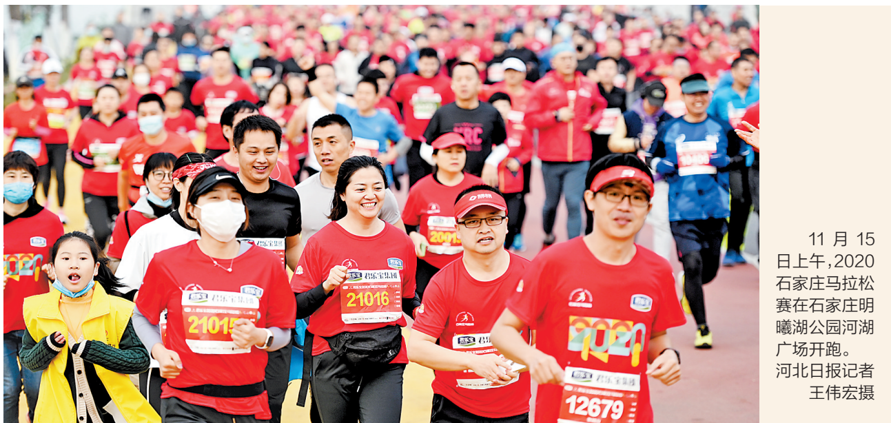
11月15日上午,2020石家庄马拉松赛在石家庄明曦湖公园河湖广场开跑。

为什么这些赛事如此火爆? “这几年,健身人群不断扩大,像一些马拉松比赛的报名早就像打新股中