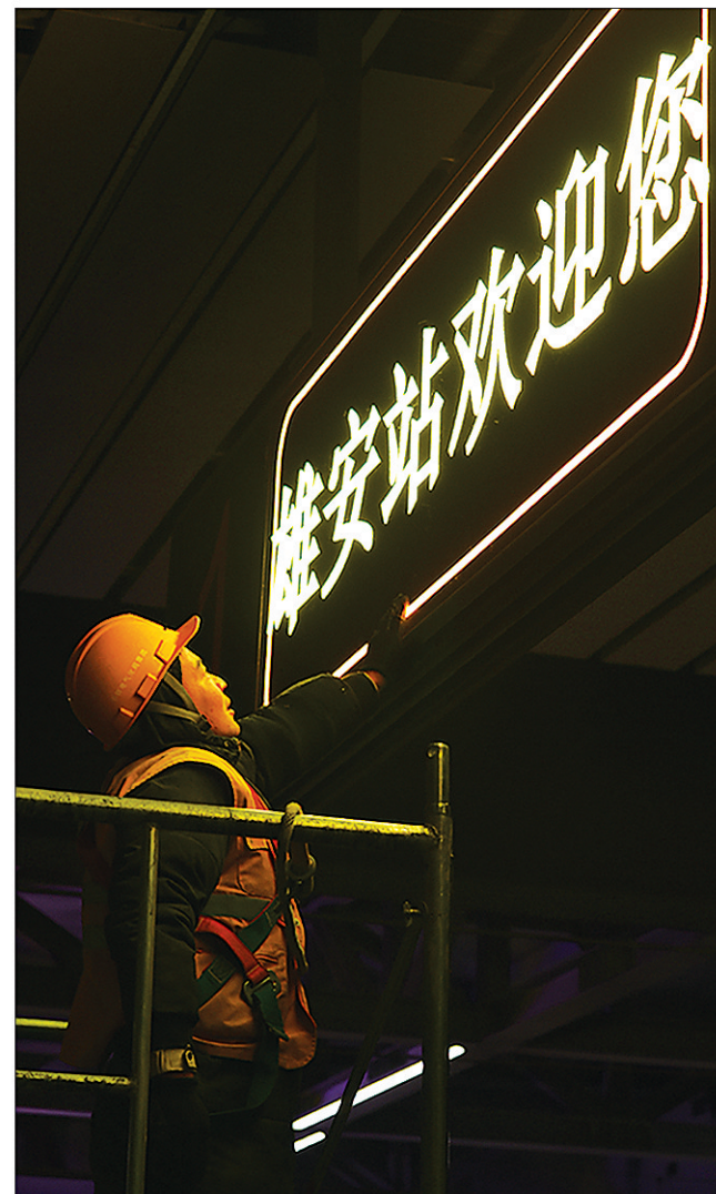
施工人员在调试电子显示屏。