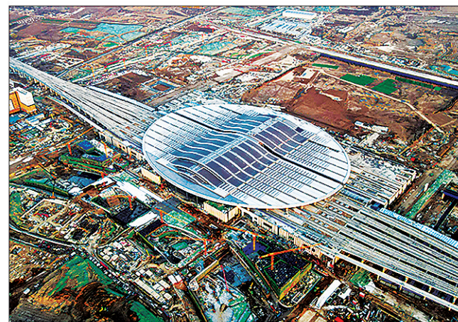
俯瞰雄安站,站房整体造型犹如荷叶上的露珠。