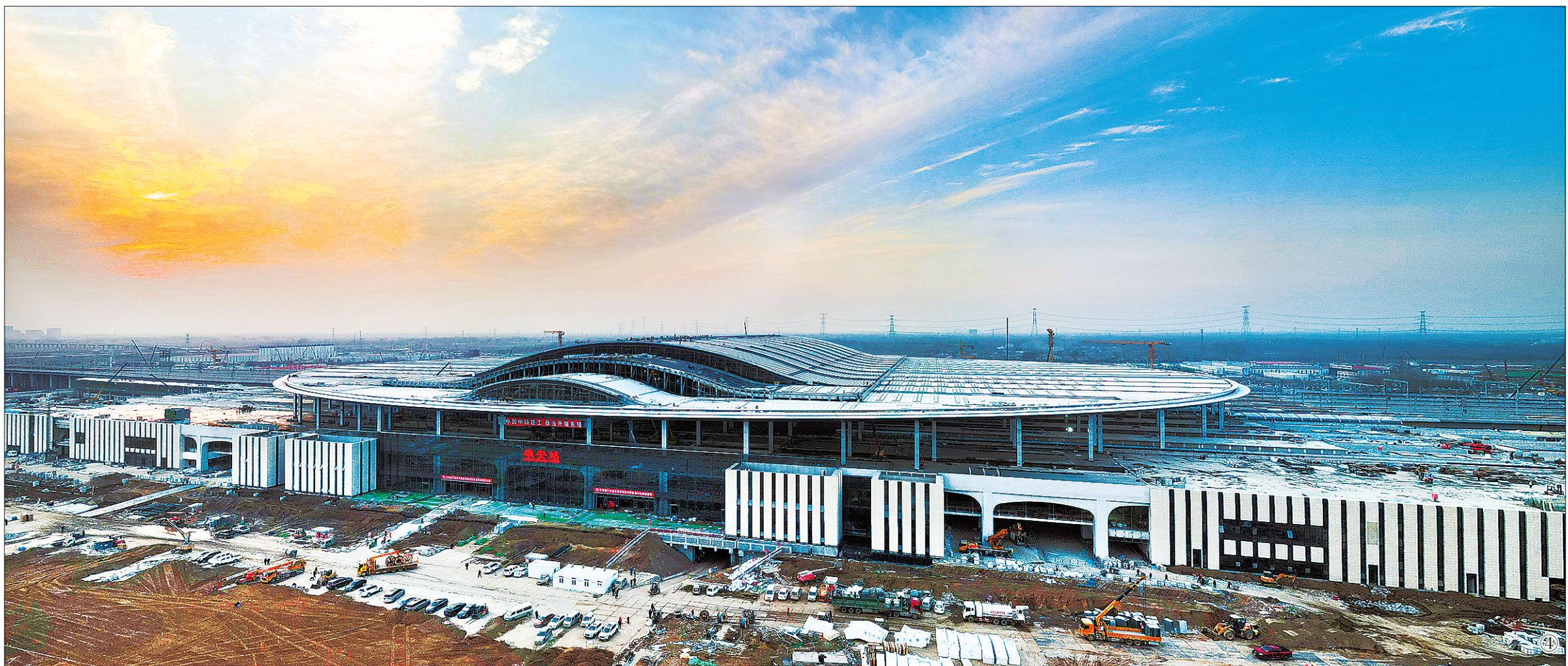
图④:11月30日拍摄的建设中的京雄城际铁路雄安站。