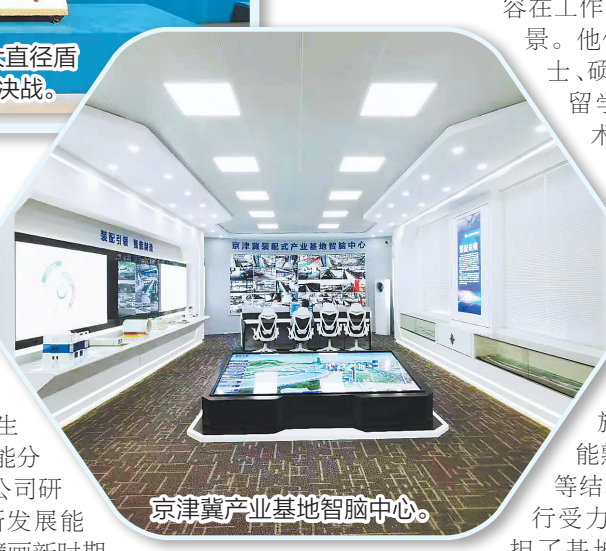
京津冀产业基地智能中心。

科技点燃梦想,创新定义未来。据了解,未来两到三年,中交装配式公司京津冀装配式产业基地将结合三地协同发展建设需要,逐步提高年产能至40万立方米混凝土的规模,为京津冀地区道路交通、轨道交通、综合管廊、城市广场、供水、排水、供电、供天然气、供热以及人防等基础设施建设发挥重要作用,逐渐成为全国装配式建筑领域最具竞争力的科技创新型高标准示范型生产基地。(黄国清)