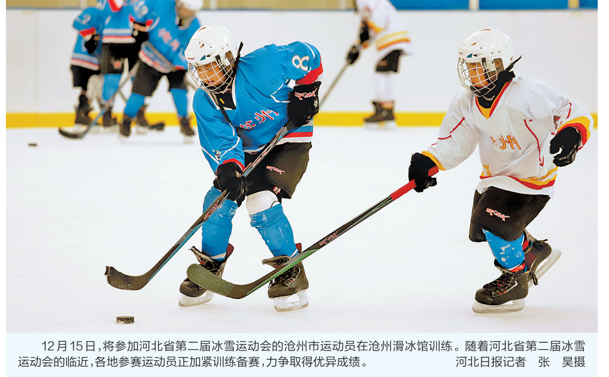
12月15日,将参加河北省第二届冰雪运动会的沧州市运动员在沧州滑冰馆训练。随着河北省第二届冰雪运动会的临近,各地参赛运动员正加紧训练备赛,力争取得优异成绩。