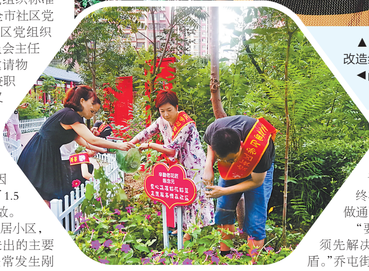
▲今年7月，草场街社区组织物业公司和居民代表共同商讨小区改造细节。 ▲尚信社区党员志愿者清理绿地里的杂草。