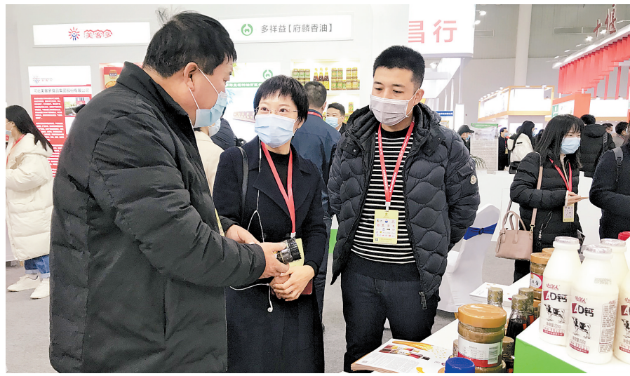
在12月3日举行的第29届中国食品博览会暨中国(武汉)国际食品交易会上,观众饶有兴趣地了解我省食品企业展品。

用电负荷的迅速增长,一方面是采暖需求的强势拉动,另一方面是工业生产逐步走出疫情影响,电力需求快速增长。省级能源大数据中心“智慧绿能云”数据显示,11月份,河北南部地区全社会用电量同比增长17.34%,增速为今年以来最高值,其中工业用电量增速达到16.46%。