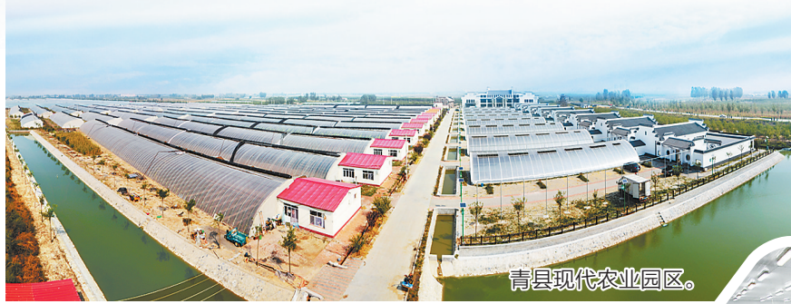
青县现代农业园区。