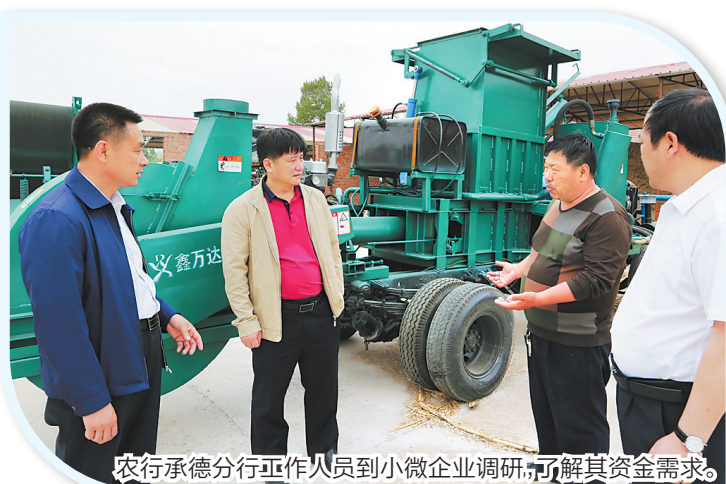
农行承德分行工作人员到小微企业调研,了解其资金需求。