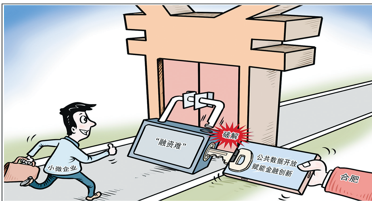
科技赋能金融创新,安徽合肥市加快推动政府公共数据有序开放,相关部门达成公共数据使用授权协议,通过向银行开放标准化数据和接口服务,有效破解小微企业融资难题。

降低银行消费投诉,关键要压实银行机构的主体责任。要求银行机构必须承担起保护银行业消费者权益的主体责任,要根据具体业务和产品种类,明确研发、宣传、销售各环节、各岗位人员的具体责任,并层层落实到位。严格规范金融产品营销宣传行为,用语要大众化,禁止误导宣传。要充分尊重并自觉保障金融消费者的财产安全权、知情权、自主选择权、公平交易权、受教育权、信息安全权等基本权利