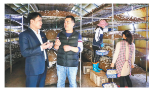
农行邢台分行持续加大 三农金融服务和支持力度 见14版