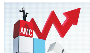
第五家全国性资产管理 公司获批开业 见16版