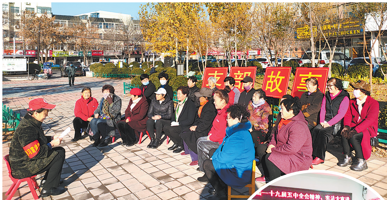
▲日前,在新华区南大街办事处志强路社区摩卡游园理论微广场,社区将老党员聚在一起,通过故事会的形式交流学习党的十九届五中全会精神心得。