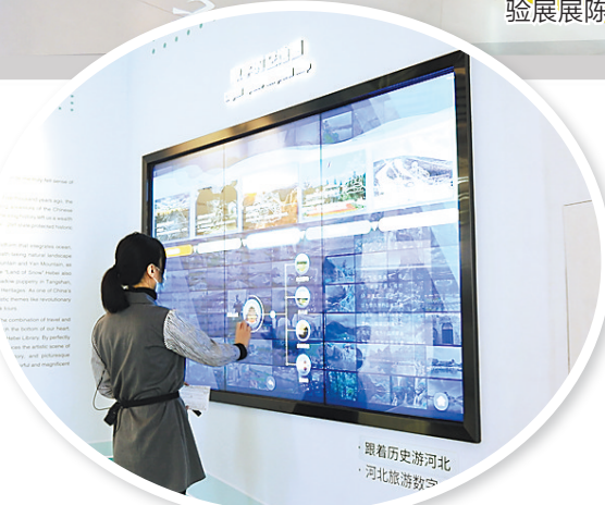
数字时空地图对海量的旅游资源进行数字化包装并作全方位解读。

“河北数字旅游体验展”将在河北省图书馆长期向公众开放,欢迎广大市民、游客前来参观体验。