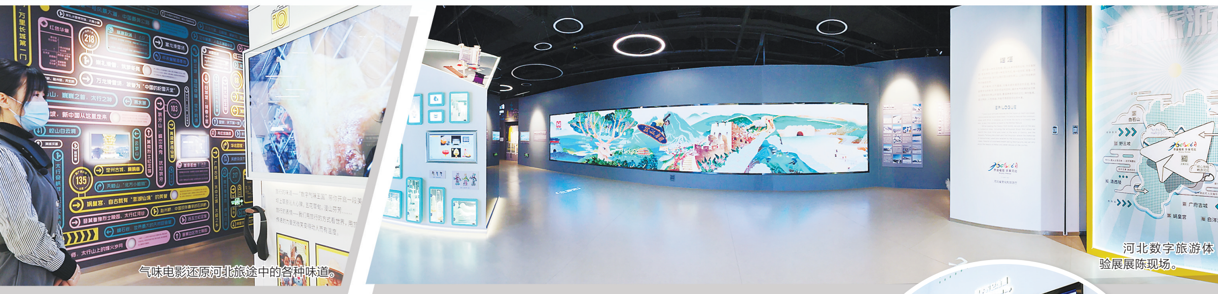
气味电影还原河北旅途中的各种味道。