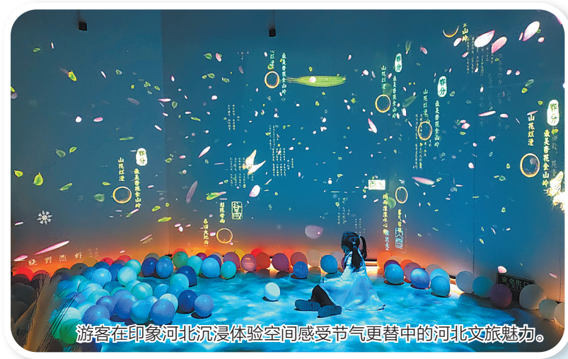
游客在印象河北沉浸体验空间感受节气更替中的河北文旅魅力。

而印象河北沉浸体验空间则将汉字艺术作为河北旅游形象的载体,在四季更迭、寒来暑往的数字场景中,提供多人同时交互体验。通过触碰墙面的气泡触发动画,可以体会河北景区与二十四节气结合的诗意之美。在由沉浸式场景所组成的移步换景的空间内,让公众体验一次欢快的河北旅游穿越之旅。