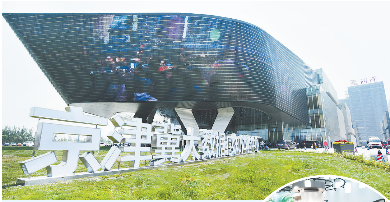
▲廊坊开发区润泽京津冀大数据感知体验中心,旨在打造京津冀地区大数据应用与服务最具竞争力的承载平台。(河北日报资料片)

三河熏鸡、百花蜂蜜、河南谢记牛肉,重庆火锅底料、新疆红枣、不粘锅……在智慧新仓购 4800 平方米的线下体验中心内,各具地域特色的产品不胜枚举,用微信扫一扫商品上的二维码,可追溯至生产源头,消费者可以